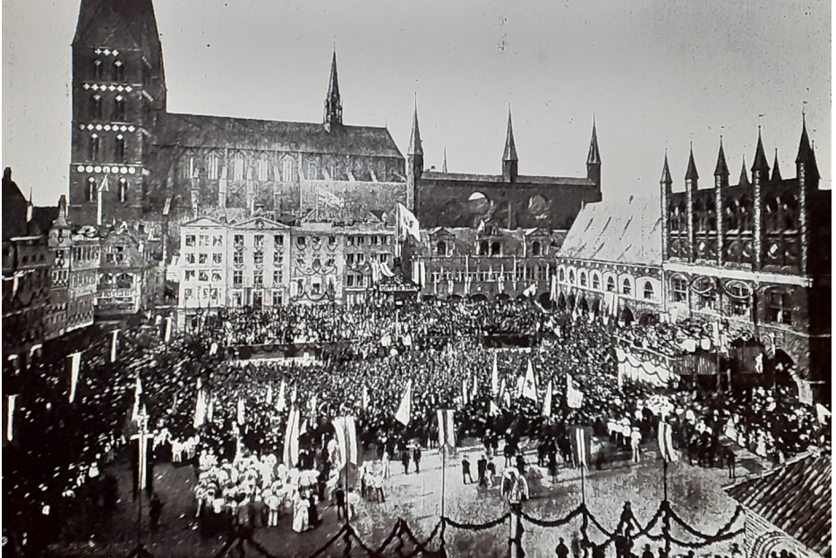
Einzug des Füsilierbataillons am 18. Juni 1871 in Lübeck (aus: Vaterstädtische Blätter vom 25. Juni 1911).