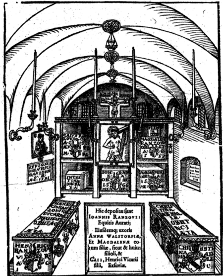
Rantzau-Grabkapelle in der Itzehoer St. Laurentiuskirche (Holzschnitt aus Peter Lindenberg's Hypotyposis , 1592)

Um hier die Verhältnisse gegenüber den anderen im Zusammenhang einer Kirchgemeinde tätigen Funktionsträgern und Personengruppen zu fassen, lohnt wieder ein Blick in Heinrich Rantzaus Testament. Dieser hatte für den Fall, dass er nicht auf der Breitenburg oder im Raum Itzehoe das Zeitliche segnen sollte, Vorsorge dafür getroffen, dass man im Rahmen des Trauerzuges, mit dem sein Leichnam feierlich zum Begräbnisort in der Itzehoer St. Laurentiuskirche bzw. einer an sie angebauten Kapelle überführt würde, an den Kirchen auf dem Weg Gedenk- und Trauerveranstaltungen abhielte. Einer der Kirchorte, an denen der Trauerzug Station machen sollte, war Bramstedt. Für die dortigen kirchlichen Verrichtungen wurden 6 Taler für den Pastor, 2 Taler für die – zu Gesang und Geleit aufgebotenen – Schüler, 1 Taler „den luders“, das heißt für