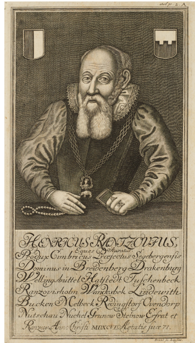
Heinrich Rantzaus im Alter von 71 Jahren