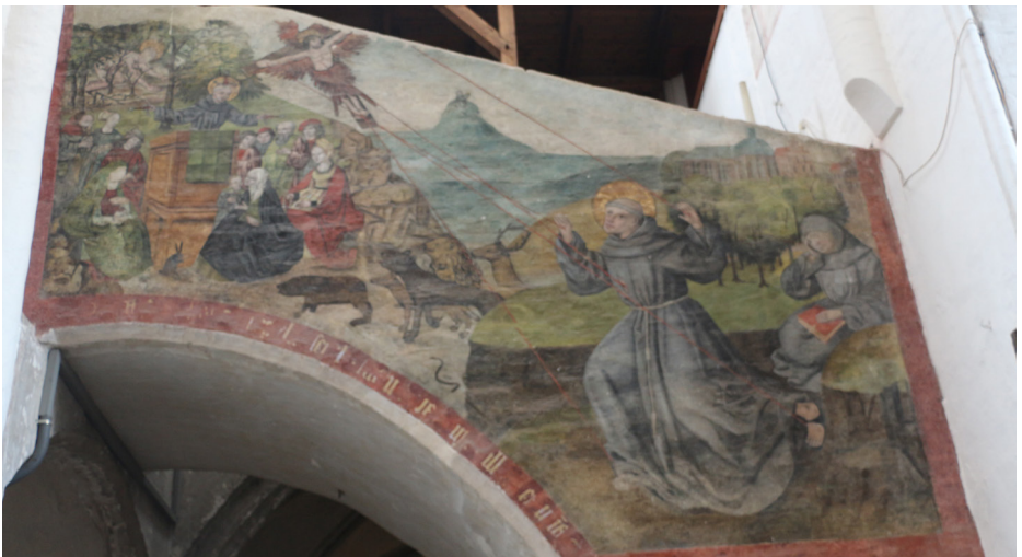
Franz von Assisi erhält die Leidensmale Christi (Fresko in der St. Katharinenkirche in Lübeck;)