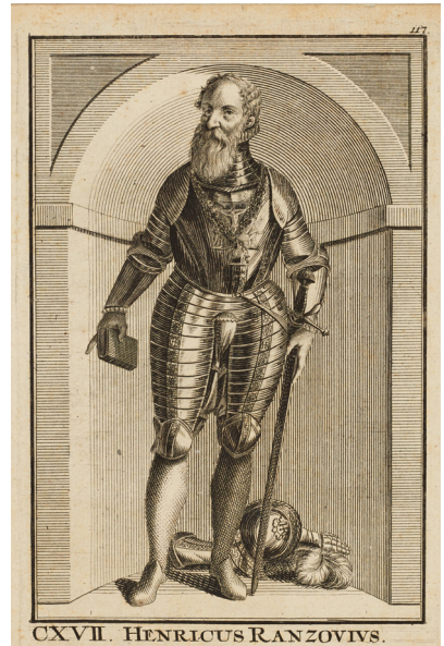
Heinrich Rantzau in Rüstung